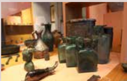
Trésor de la tombe dite « de Marcus », musée Juliobona

Un projet de scénographie urbaine permettra de mieux comprendre le développement de la ville aux époques antique, médiévale et contemporaine. Les différents éléments de ce parcours faciliteront notamment la compréhension de l'organisation de Juliobona par les habitants et touristes actuels.