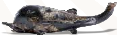
Fiole delphiniforme - Tombe «de Marcus».