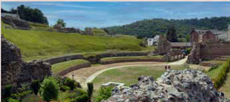
Théâtre antique de Lillebonne

L'expérience visiteur doit être pensée dans son ensemble, c'est pourquoi un accueil avec parking, navette, informations touristiques, billetterie... sera créé, tout comme un pôle pédagogique et un archéolab.